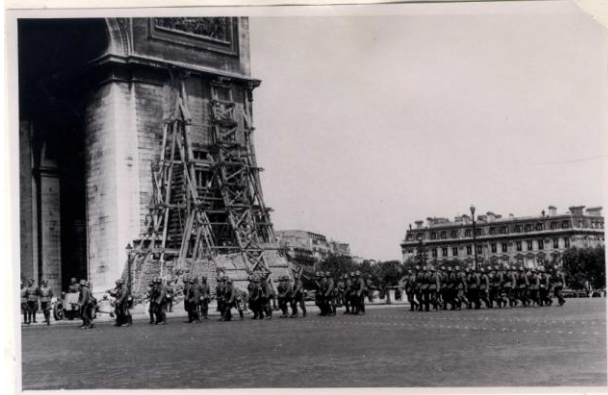
Geçit resmi 14 Haziran 1940. 75