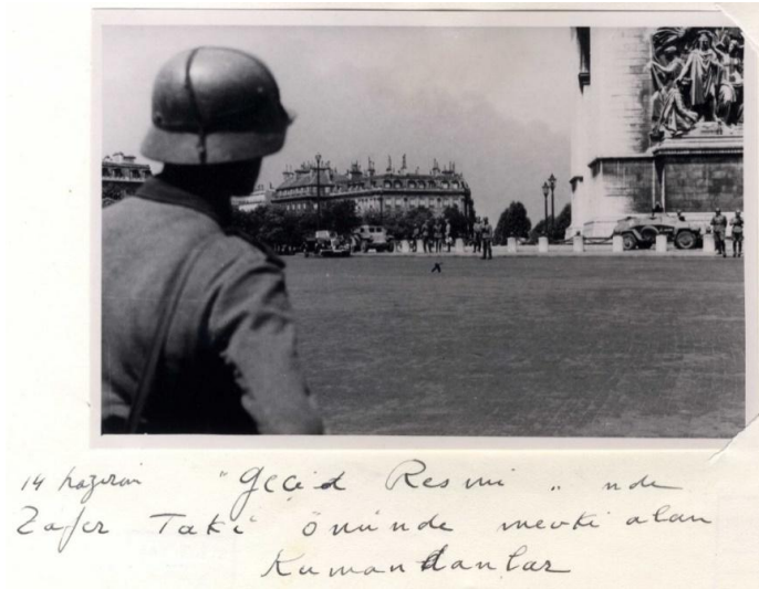
14 Haziran geçit resmi. Zafer takı önünde mevki alan kumandanlar. 72