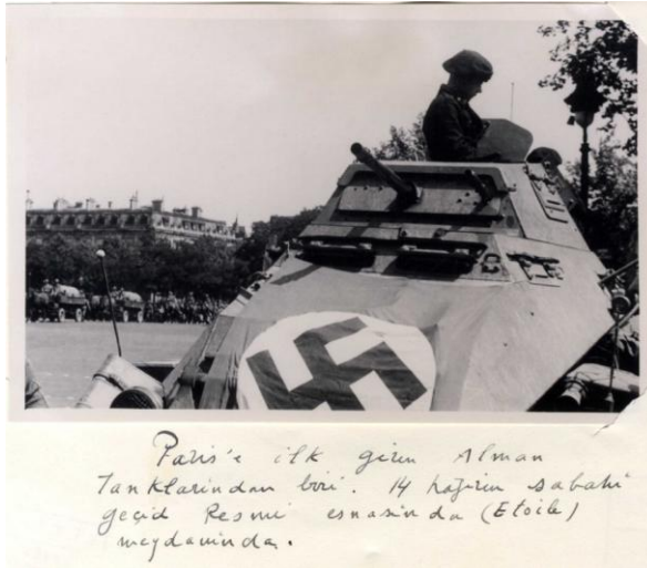
Paris'e ilk giren Alman tanklarından biri 14 Haziran sabahı geçit resmi esnasında Etoile meydanında. 70