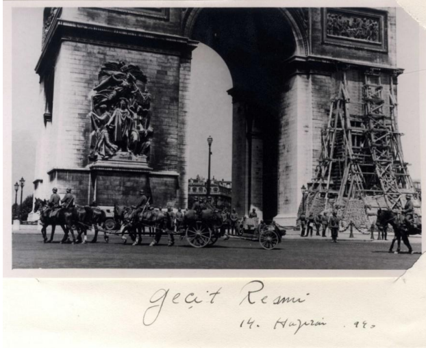
Geçit resmi 14 Haziran 1940. 77