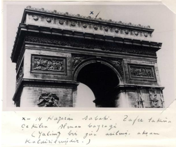
14 Haziran sabahı zafer takına çekilen Alman bayrağı yalnız bir gün asılmış akşam kaldırılmıştır. 71