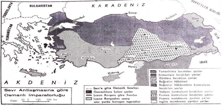
Resim 3: Sevr Antlaşmasına Göre Osmanlı İmparatorluğu

Haritalar, yeryüzüne ilişkin sembolik anlatımlar içerdiği için, zihinsel açıdan yetişkinler gibi olmayan çocukların kolaylıkla anlayabileceği somutlaştırılmaları içeren haritalara ihtiyaç olduğu ortadadır. Diğer yandan bu sadece ilkökul seviyesinde bir sorun olamayıp, tarih ve coğrafya dersleri için bile genel bir haritalama sorununun olduğundan bahsetmek mümkündür. Ders kitaplarında harita kullanımları üzerine yapılan araştırmalara bakıldığında tarih konularının öğretiminin gerçekleştirildiği ders kitaplarında kullanılan haritalarda, harita tasarımları aşamasında dikkat edilmesi elzem olan temel özelliklerin çoğu kez görmezden gelindiği, ya da diğer bir deyişle dikkatlice tasarlanmadıklarına yönelik bulguların varlığı dikkat çekicidir. 29 Ders kitaplarında harita kullanımının, öğretimi ilgi çekici hale getireceğinden pedagojik açıdan öğrencilerin seviyesine uygun, yakın çevrelerini esas alacak şekilde tasarlanması tavsiye edilmektedir. 30 Ayrıca tarih konularının öğrencinin zihninde bir mekâna oturtulması büyük ölçüde harita kullanımı sayesinde gerçekleşebildiğinden, ders kitaplarında harita görsellerine daha çok yer verilmelidir. 31